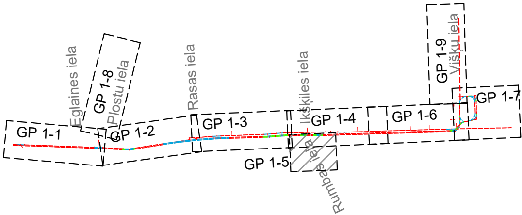
Lapu izkārtojuma shēma: