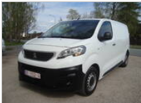
Peugeot Expert 13900 €