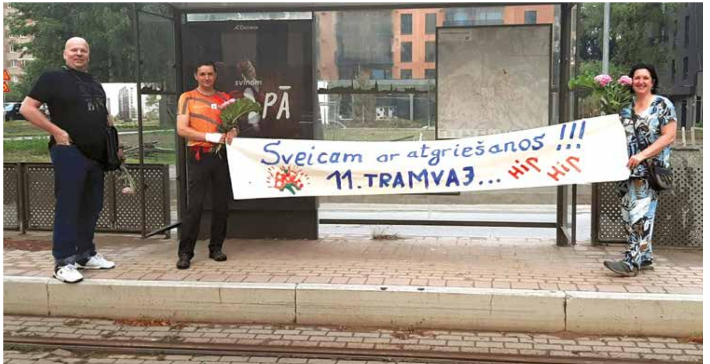
Pirmajam reisam līdzī jūta un patīkamu pārsteigumu tā dalībniekiem bija sagādājuši Mežaparka iedzīvotāji pieturā “Mirdzas Ķempes iela”, sveicot 11. tramvaju ar atgriešanos. Paldies viņiem par pozitīvisma lādiņu, jo dalīts prieks – divkārt liels!

Kopš 1992. gada katros dziesmu svētkos viņš ir strādājis šajā līnijā, un vienmēr tramvajā skan dziesmas – 11. tramvajs kļūst par “dziedošo tramvaju”. Ir paties prieks, ka arī šajos svētkos skanīgais “dziesmu svētku tramvajs” varēja doties līnijā.